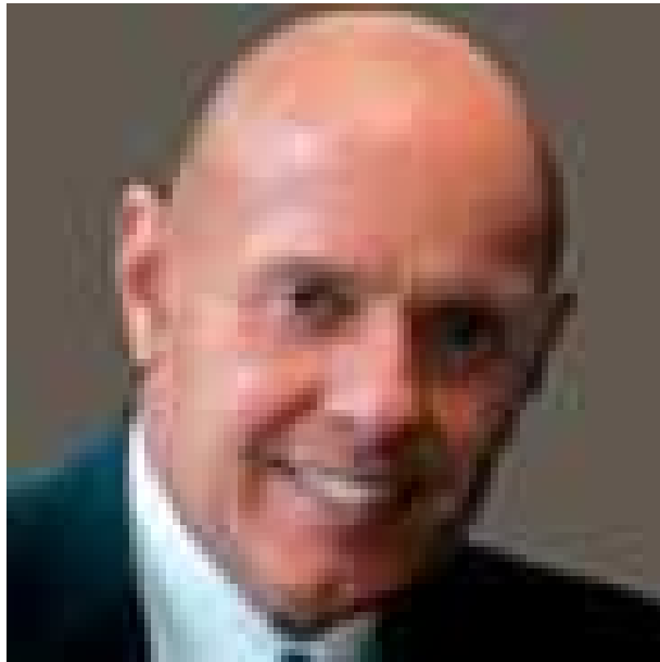
Stephen Covey Revista Exame/Jan/2005

Um de cada 4 gestores ou é incompetente para o cargo ou não tem caráter para o cargo.